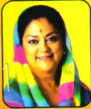
श्रीमती वसुन्धरा राजे मुख्य मंत्री राजस्थान सरकार