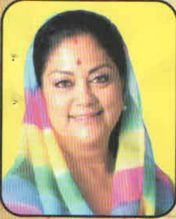
श्रीमती वसुंधरा राजे मुख्य मंत्री राजस्थान सरकार

राजस्थान टाउनशिप पॉलिसी-2010 के अन्तर्गत निजी खातेदारी की अनुमोदित योजना खसरा नं. 259 एवं 260