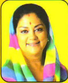
श्रीमती वसुन्धरा राजे मुख्य मंत्री राजस्थान सरकार