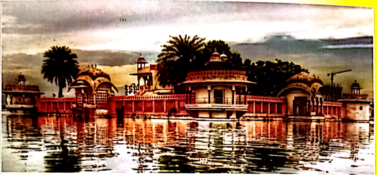
किशोर सागर तालाब में स्थित जग मंदिर पैलेस