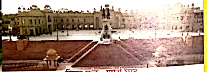
रिवर फ्रंट- शौर्य घाट पश्चिमी छोर का प्रवेश द्वार