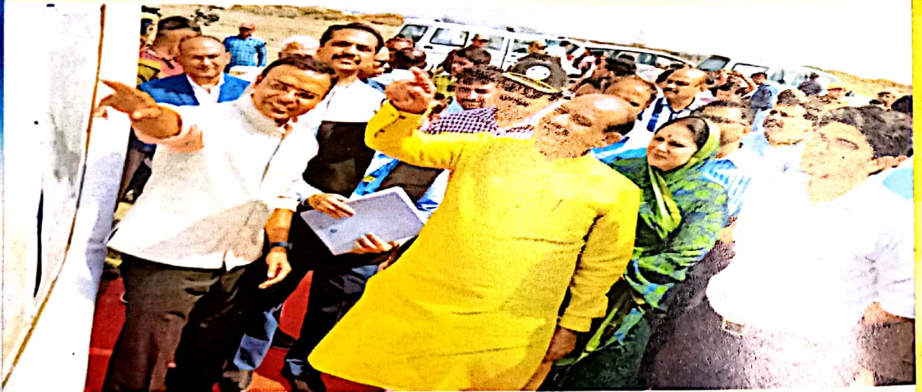
माननीय अध्यक्ष लोकसभा श्रीमान् ओम बिरला जी द्वारा शम्भूपुरा ग्रीन फिल्ड एयरपोर्ट नक्शों का अवलोकन किया गया।