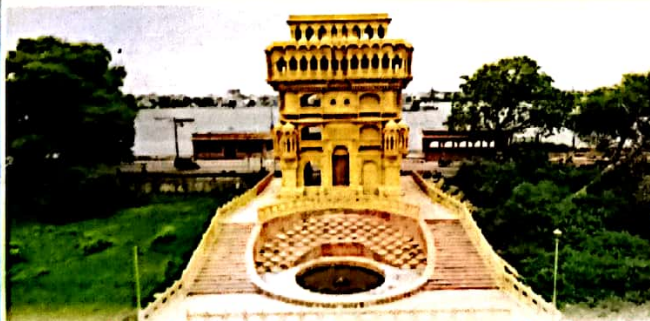
सालिम सिंह की हवेली / स्वर्ण महल की प्रतिकृति स्थान : किशोर सागर पाल, कोटा