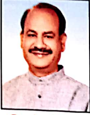
श्री ओम बिरला माननीय अध्यक्ष, लोक सभा भारत