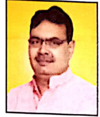
श्री भजनलाल शर्मा माननीय मुख्यमंत्री राजस्थान सरकार