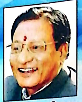
श्री शांति धारीवाल नगरीय विकास, स्वायत्त शासन एवं आवासन मंत्री, राज. सरकार