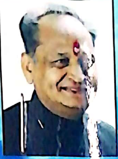
श्री अशोक गहलोत मुख्यमंत्री राज. सरकार